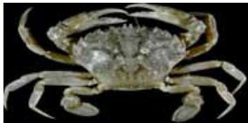
السرطان أو السلطعون

وتعتمد الرؤية في المفصليات على تركيبات مختلفة من العيون حيث تتمكن بعض الأنواع من تحديد الاتجاه الذي يأتي منه الضوء فقط، وتعتبر العيون هي المصدر الرئيسي للمعلومات، ولكن العيون الرئيسية للعنكبوتيات يمكنها أن تشكل الصور وأن تدور في حالة تعقب الفريسة. كما تمتلك مفصليات الأرجل مجموعة واسعة من أجهزة الاستشعار الكيميائية والميكانيكية تعتمد في معظمها على حدوث تعديلات في العديد من الشعيرات التي تبرز من البشرة الخاصة بهم. تتنوع الطرق التي تستخدمها المفصليات للتكاثر والنمو حيث تستخدم جميع الأنواع البرية الإخصاب الداخلي والذي يعتمد في كثير من الأحيان على التحويل الغير مباشر للحيوانات المنوية عن طريق الأرض وليس من خلال الحقن المباشر، بينما تستخدم الأنواع المائية الإخصاب الداخلي أو الخارجي، تضع كل المفصليات تقريباً البيض بينما تلد العقارب. تختلف صغار المفصليات عن البالغين والبرقات والديدان أنها تفتقر إلى وجود أطراف مفصلية وتخضع في النهاية إلى التحول الكلي لتتشبه شكل البالغين. ويختلف مستوى الرعاية التي تتلقاها الصغار من الأم يختلف من رعاية معدومة تقريباً إلى مستوى متقدم جداً من الرعاية في حالة العقارب