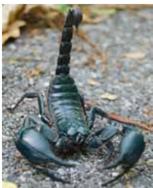
أحد العقارب الآسيوية المشهورة

عديدات الأرجل وتتميز بأعضاء مركبة من قطع مفصلة وهيكل خارجي للحماية. وتتواجد في غالب الكرة الأرضية في البحر، واليابسة