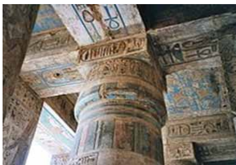
معبد رمسيس الثالث في مدينة هابو من الداخل.

• أصدر أوامره لبناء ملحقات هامة في المعابد