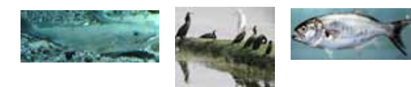
السماك الأزرق غراب البحر والنازلي الفضي

متماثلات الأرجل هي نوع من القشريات، وأكثر القشريات تنوعا في شكل الجسم. صغيرة الحجم، حيث يتراوح حجمها ما بين ٣٠٠ ميكرون إلى ٥٠ سم. جسمها مضغوط من الظهر والبطن، و ينقسم جسمها إلى ثلاث مناطق: منطقة الرأس، ومنطقة الصدر، ومنطقة البطن. تحمل في منطقة الرأس زوجين من قرون الاستشعار، و زوج من العيون المركبة، وفم مكون من أربع أجزاء. والزوج الأول من قرون الاستشعار له وظيفة كيميائية حسية، أما الزوج الثاني عبارة عن تراكيب لمسية و في منطقة الصدر تحمل سبعة أزواج من الأرجل لها نفس الحجم والشكل (( لذلك سميت بمتماثلات الأرجل )) . أما المنطقة البطنية فإنها تنقسم إلى منطقتين هما البطن التي تحمل الأرجل السابحة التي تساعدها على السباحة و التنفس، و منطقة الذيل التي تحمل الذنب والأرجل الذيلية.