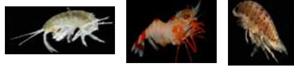
متماثلات الأرجل الروبيان الغماريات

التغذية السرطان حيوان كالش (يتغذى على الحيوانات والنباتات) وهو يتغذى على المخلفات والغماريات والروبيان ومتماثلات الأرجل وروبيان السرعوف وكثيرات الأشعار وثنائيات الصدفة وبطنيات القدم وهو فريسة لعدة أنواع من الأسماك كالبروك الأوروبي والنازلي الفضي والنازلي المرقط والنازلي السنجاب والقذ والحدوق وغراب البحر والسماك الأزرق.