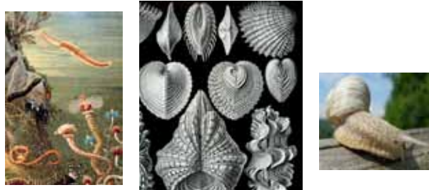
بطنيات القدم ثنائيات الصدفة كثيرات الأشعار