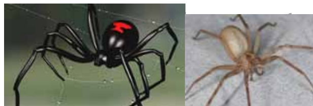
عنكبوت الأرملة السوداء عنكبوت الناسك البني

يصنع العنكبوت شبكته من خيوط قوية من البروتين تُسمى الحرير، حيث تُنتج سبعة أنواع مختلفة منه، لذلك تم تصنيف العنكب حسب نوع الشبكة التي تصنعها، منها: عنكب الشبكة المتشابكة، والعنكبوت غازل الشبكة الدائري، والعنكبوت قمعي الشبكة، وعنكبوت الشبكة الحاضنة، إذ تنتج العنكب الحرير لعدة أغراض، منها: حماية نفسها من السقوط، وصنع أكياس البيض، ولف الفرائس عن طريق صنع الشبكات، وبناء مسكن وجحر خاصة بها و تتم عملية إنتاج الحرير عن طريق ضغط العنكبوت لبطنه بعد صنعه بواسطة عدّة أنواع من الغدد الحريرية التي تمتلك قنوات ترتبط بالمغازل لها فتحات خارجية، حيث تتحكم الصمامات العضليّة بمعدل تدفق الحرير، ويوجد ٧ أنواع من الغدد لدى العنكب ناسجة الشبكات