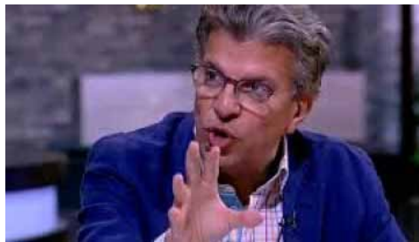
الجرئ خالد منتصر قاطعوا أفكار قاطع الرأس قبل مقاطعة الجبن الفرنسي

قاطعوا أفكار قاطع الرأس قبل مقاطعة الجبن