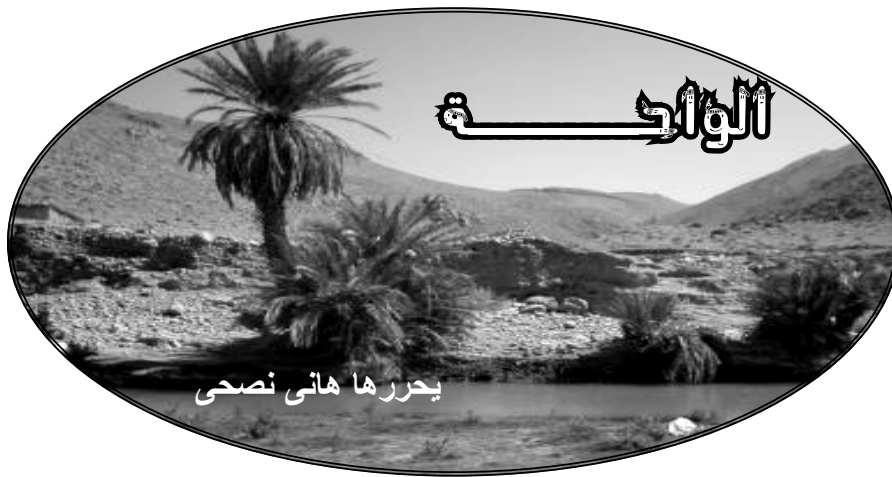
يحررها هاني نصحي

اصبح ضيفاً دائماً على وسائل الاعلام حتى صار وجهه مالوفاً لدى الجميع، ثم اعلنها صريحة مع زيادة اتباعه بأنه لن يتردد في استخدام القوة ليبسط ارادة الله على الارض، ثم عندما وافته الفرصة لم يتوانى واستخدم قوته وقوة اتباعه من اجل ان تتحقق الرسالة السامية التي اعتنقها. لم يكن الابن يبعد عن الاحداث اليومية المتلاحقة والتي كان ابوه طرفاً اساسياً فيها..كان اعجابه وزهوّه بالاب مفرطاً فتمنى ان يكون لديه جزءاً يسيراً