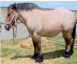
خيل ينام وهو قائم