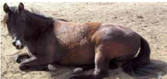
وضعية الأذن للأمام تشير بحاجة إلى الاستلقاء على الأرض للوصول