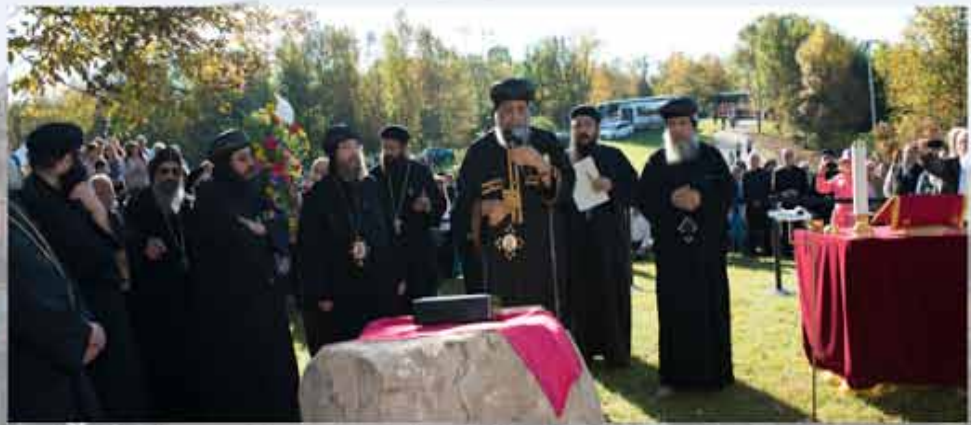
His Holiness Pope Tawadros II laying down the cornerstone of St. Anthony Coptic Orthodox Monastery.

"God Loves a cheerful giver" 2 Cor 9:7 The monastery gives tax receipts