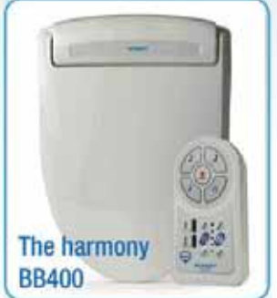
The harmony BB400

Best certified electric Bidet in its category, Best quality & cost ratio All options in one bidet : heated seat, instant hot water. Easy to install, only one connection