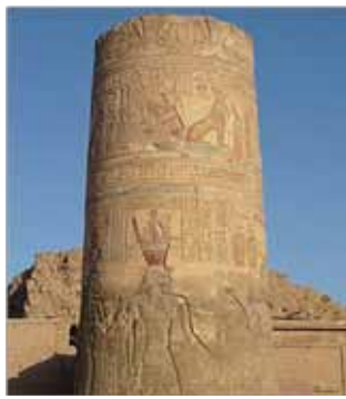
عمود وهو جزء من المعبد الذي استكمل في عهد الإمبراطور الروماني تيبيريوس ونشاهد الإمبراطور الروماني هنا بالزي الفرعوني

الآن أدوار هذا التطور نظرًا إلى تدهم معابد العصر الصاوي (660 - 525 قبل الميلاد). وظهور أنواع هذه الرؤوس كاملة على عهد الأسرة الثلاثين في معبد نكتانبو الثاني، أي في أواسط القرن الرابع قبل الميلاد، يحملنا على الاعتقاد بأن تاريخ هذه الرؤوس لا بد من أن يرجع إلى عصر سابق على الأسرة الثلاثين. وإذا ما محصنا جميع الاعتبارات المختلفة وجدنا أن العصر الصاوي أنسب وقت لذلك بسبب نهضة الفنية وما ساد فيه من السلام والرخاء. وإذا كانت هذه الرؤوس في دور التكوين في خلال القرنين السابع والسادس قبل الميلاد، أي قبل ظهور العمود الكورنثي بمدة طويلة، وإذا ما تذكرنا أصل الأعمدة المصرية المزدانة بالزهور، وإذا ما عرفنا أن العناصر التي تتكون منها الرؤوس الجديدة مصرية بحت، فإنه يتضح لنا بطلان الزعم الذي يرى في الرؤوس الجديدة أثرًا للعمود الإغريقي الكورنثي. وإذا كانت ثمة علاقة بين الاثنين، فإن العكس أقرب إلى الصواب، لأن المصري كان يزين رؤوس أعمدته بالأزهار قبل عهد الإغريق بالأعمدة، كما أن الحلقات (Volutes) الجانبية في الرؤوس الكورنثية تحمل شبهًا كبيرًا للأطراف المتدلّية من أوراق زهرة السوسن (Iris)، التي كانت رمز مصر العليا، وتستعمل في الزخرفة في مصر الدولة الوسطى