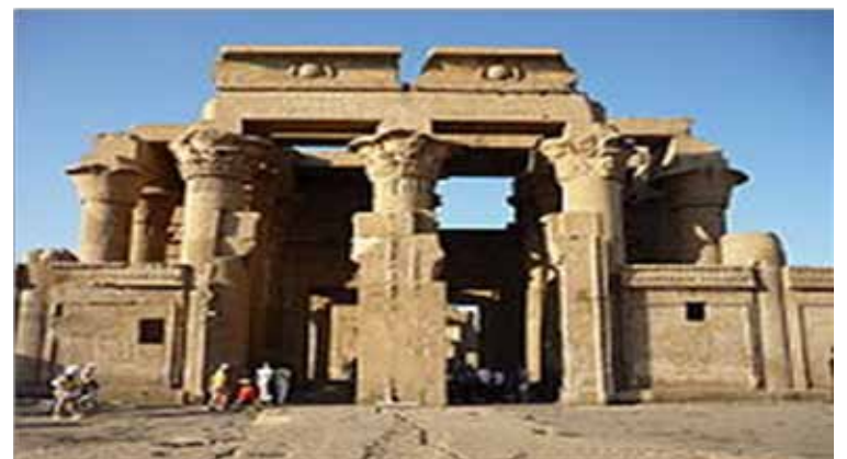
أما رؤوس الأعمدة في المعبد فهي من العسير بل من المحال أن نتتبع

والأنواع المتعددة المعقدة لهذه الرؤوس الجديدة لا يمكن أن تكون قد استنبطت في خلال فترة قصيرة، بل لا بد من أنها كانت ثمرة تطور طبيعي طويل، لكنه