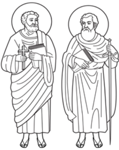
بولس الرسول وبطرس الرسول

فبعدهم بمجد عظيم في الملكوت قائلاً: "أنتم الذين تبتوا معي في جاري. وأنا أجعل لكم كما جعل لي أبي ملكوتاً. لتأكلوا وتشرّبوا على ما أدتني في ملكوتي. وجلسوا على كراسي تدينون أسباط إسرائيل الاثني عشر" (لوقا: ٢٢-٣٠). ومع هذه الكلمات الذهبية فإن نغمات هذا اللحن شجية جداً وتستغرق حوالي ١٥ دقيقة. تنتقل من النغمات الهادئة الحزينة في بداية اللحن إلي نغمات متهللة جداً في نهايته. خلق بنا في السماء مرّات ومرّات. حتى أنني عندما أسمعته لا أود أن ينتهي أبداً!!