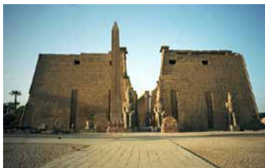
مدخل الصرح من معبد الأقصر. أحد أهم المعابد في عصر الدولة الحديثة

واصل حكام الدولة الوسطى ٢٠٥٥-١٦٥٠ قبل الميلاد، توحيد البلاد، بعد انهياره، لبناء الأهرامات. وكانت باقي الاماكن القليلة تحافظ على المعابد والمعابد المكرسة للآلهة زادت من استخدام الحجر. وكان نمط تصميم المعبد وجود ملاذا بعد قاعة الأعمدة وظهر كثيراً هذا النمط في تلك الفترة.