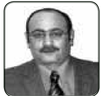
بقلم/ مدحت موريس

مكثت فترة لأستريح من عناء الأعوام السابقة لعلي أعود متجدد النشاط.... لكن لفت نظري أن دنيا لم تعد تسأل عني حتى من باب العلاقة الإنسانية. وتيقنت أنها فيما يبدو ذهبت للإستجمام في بلد آخر